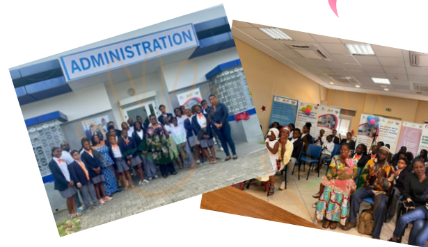
Our students spreading Love at Radiotherapy Center

4th February / 4 février : World Cancer Day Journée mondiale contre le cancer.